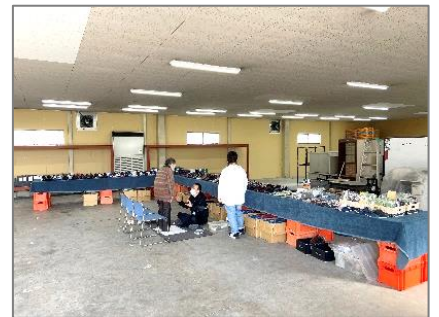
11月24日 パラマウント足と靴の相談・販売会

今年度、本部配送センターの西隣にある事務所兼倉庫の建物を新たに借りました。 本格的に使用するための内装リフォームやトイレの入替え工事も終了し、11月後半から、新規加入者交流会「こじカフェ」や「パラマウント足と靴の相談・販売会」、委員会活動などにより、利用が始まっています。 屋根の看板の架け替えや、外装のリフォームなど、まだやらなければいけないところはありますが、広い倉庫部分では、生産者を招いての交